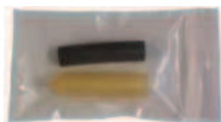
Kit intestatura cavo

* Massima lunghezza del circuito scaldante a 5 °C e 16 A di assorbimento Per il cablaggio vedi scheda tecnica a pg. 102